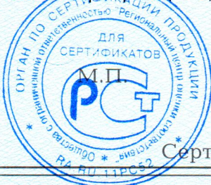
Схема сертификации 3, инспекционный контроль 1 раз в год.

Место нанесения знака соответствия – в товаросопроводительной документации, графическое изображение знака соответствия по ГОСТ Р 50460-92 с надписью «Добровольная сертификация».